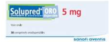
Les corticoïdes par voie orales