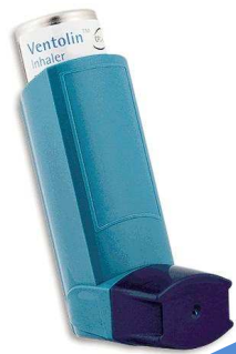
Les B2 mimétiques