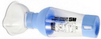
La chambre d'inhalation